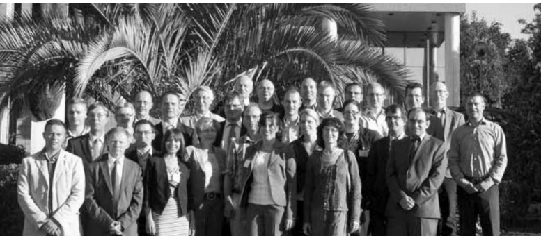
La FSRM et les partenaires du projet européen Polybright en réunion à Bilbao, Espagne